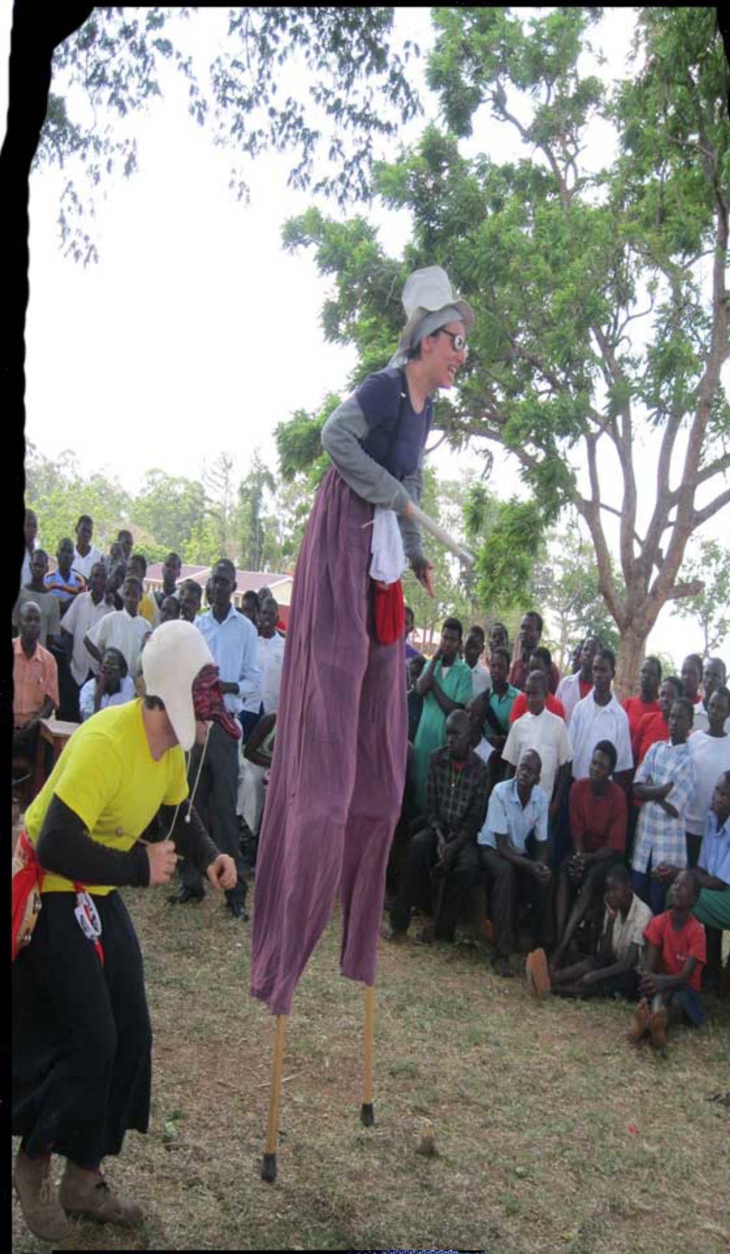
Spettacolo a Minakulu

testimoniata da fotografie e da un video ricco d'interviste.