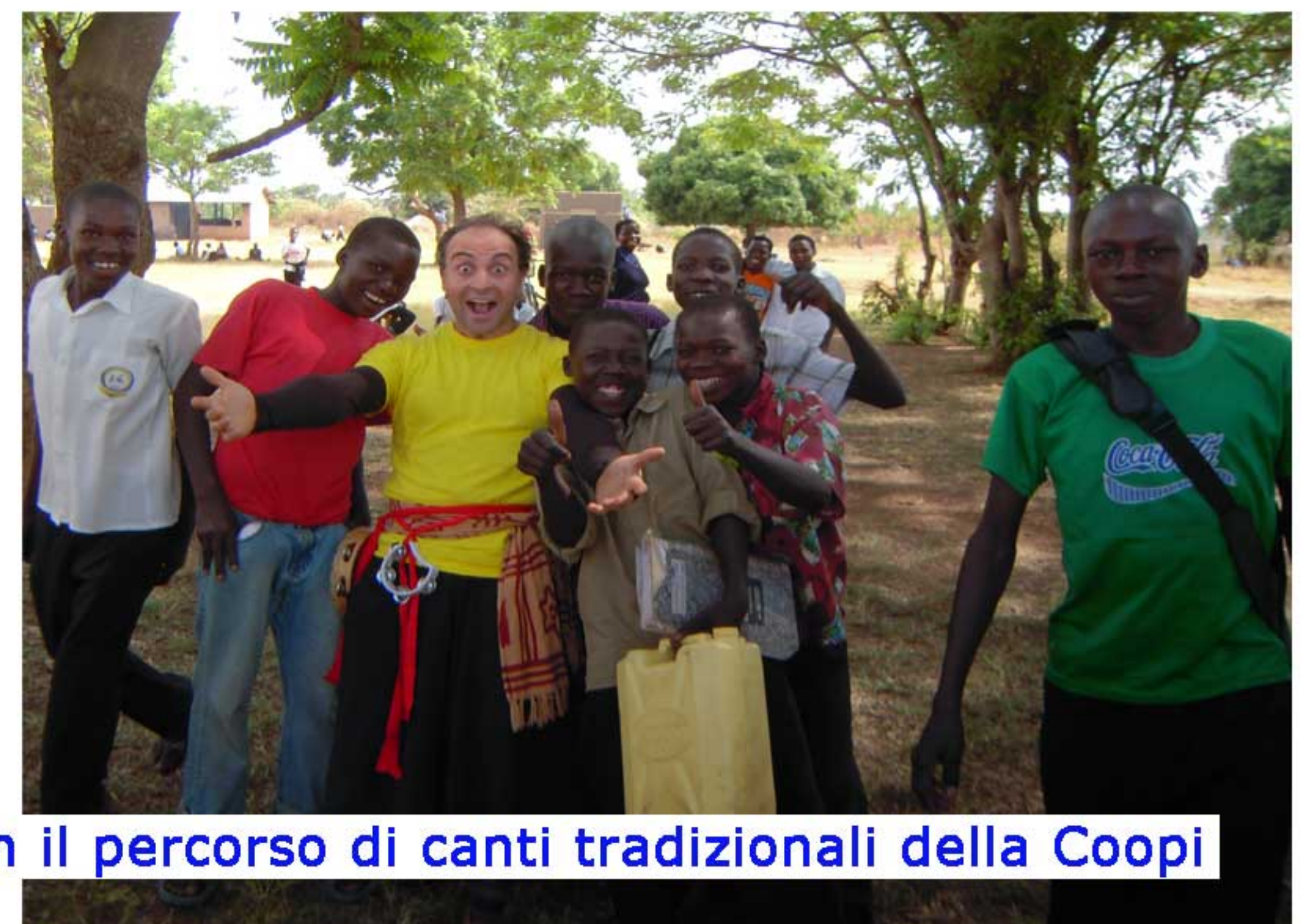
Incontro con il percorso di canti tradizionali della Coopi