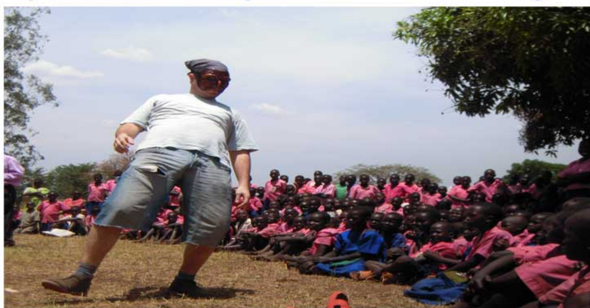
Spettacolo nella scuola di Acaba