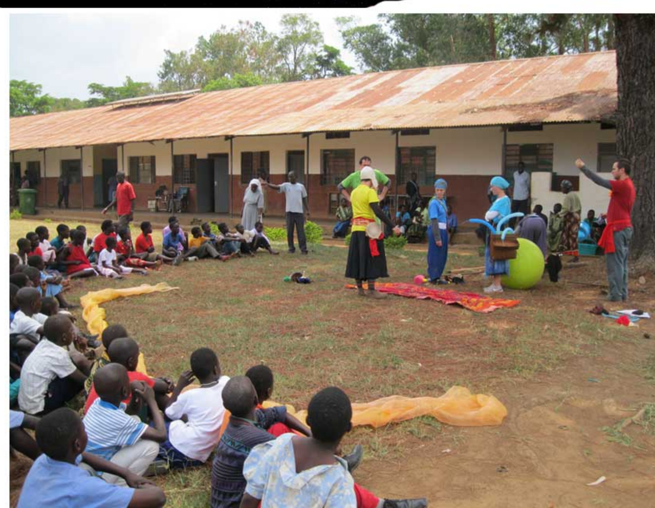
Spettacolo all'ospedale di Aber in Oyam