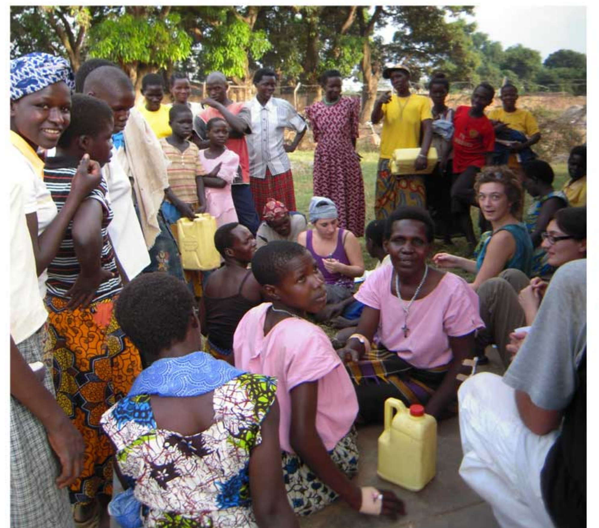
Pubblico ad Aber